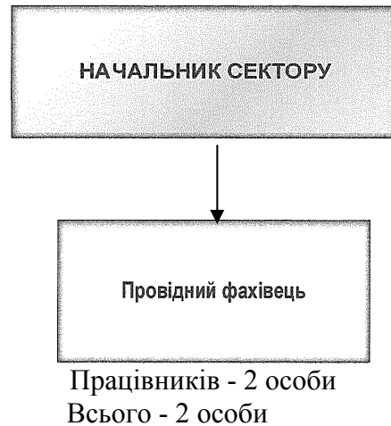
Малюнок27 – Примірна структура сектору з питань цивільного захисту громади

У зв'язку із децентралізацією влади, відповідно до Закону України від 05.02.2015 року №157- VII «Про добровільне об'єднання територіальних громад» та виходячи із техногенного навантаження території громади, а також забезпечення і впровадження комплексу заходів цивільного захисту населення громади, пропонується створити постійнодіючий орган управління системою цивільного захисту в громаді , а саме - сектор з питань цивільного захисту у складі двох осіб (начальник сектору, провідний фахівець) ( малюнок 2 )